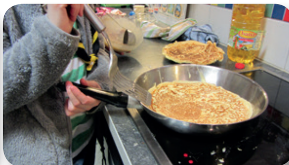
Und dann ab in die Pfanne... Möglichst dünn, natürlich...