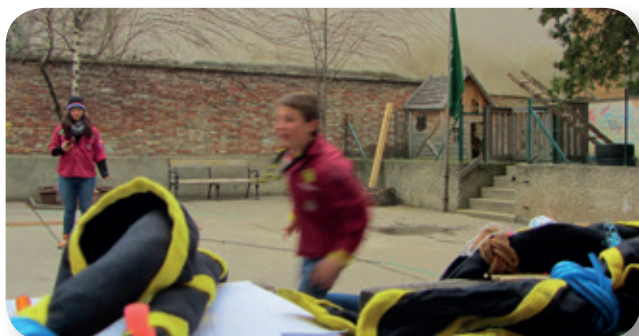
Laufen für die 38er...