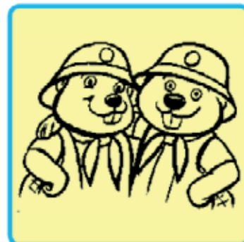
WIR HALTEN ZUSAMMEN!