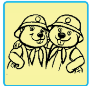
WIR HALTEN ZUSAMMEN!