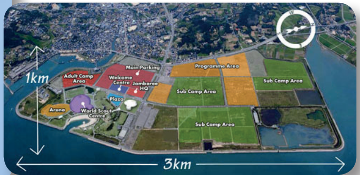
Der gigantische Lagerplatz ist fast 3km 2 groß!