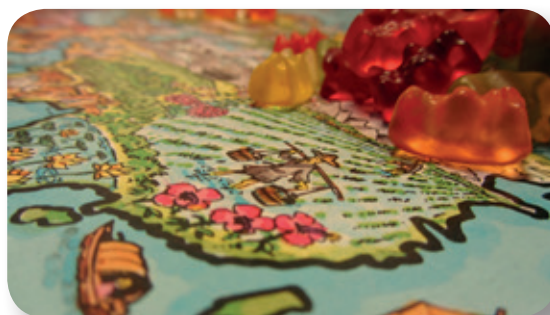
Wie viele Menschen leben auf der Welt – und wo? Mit Gummibärchen musste es nachgestellt werden...